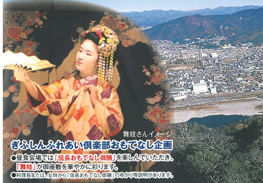
舞妓さんイメージ